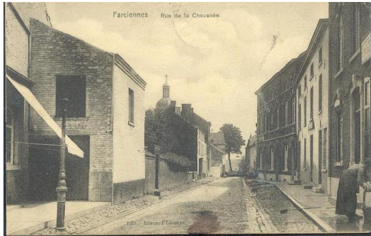
Rue de la Chaussée (à gauche l'église)