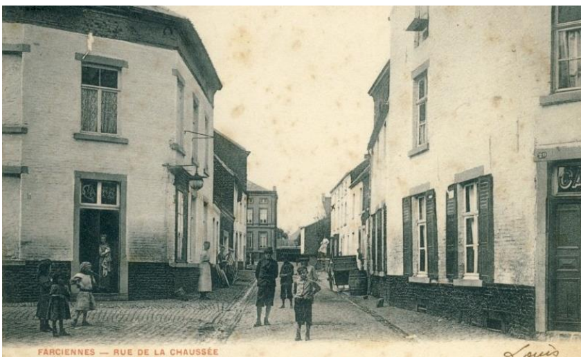
Rue de La Chaussée (dans le fond : l'ancienne maison Communale)