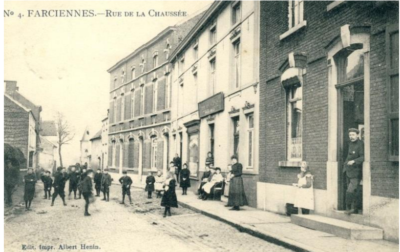
Rue de la Chaussée en direction de l'église