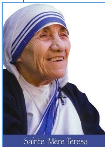
Sainte Mère Teresa

Janvier 1929 : départ pour Calcutta où elle enseigne à l'école Ste Marie jusqu'en 1948.